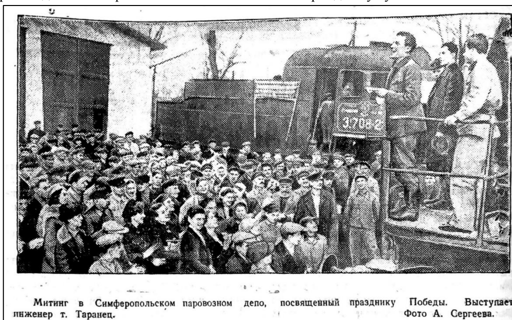
Рис. 10. Митинг в Симферопольском паровозном депо, посвящённый празднику Победы

Военная тема не ушла из информационной повестки «Красного Крыма» после подписания акта о капитуляции фашистской Германии. Даже мирные производственные фото газеты в послевоенный период несут упоминание о войне и