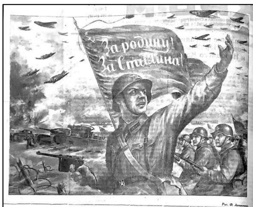
Рис. 3. За родину! За Сталина!

Номер «Красного Крыма» от 23 июня 1941 г. содержал и первые военные изображения: рисунок Фёдора Литвинова с идущими в бой солдатами (в советских газетах периода войны рисунки часто восполняли отсутствие оперативных фото), а также снимок Э. Бендицкого с митинга работников машиностроительного завода имени Куйбышева (фото с митингов, на которых заявлялось о решимости защищать