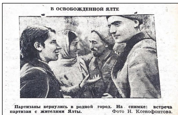
Рис. 8. Встреча партизан с жителями Ялты

за Красную Армию, благодарность ей за освобождение, демонстрировали единство армии и народа.