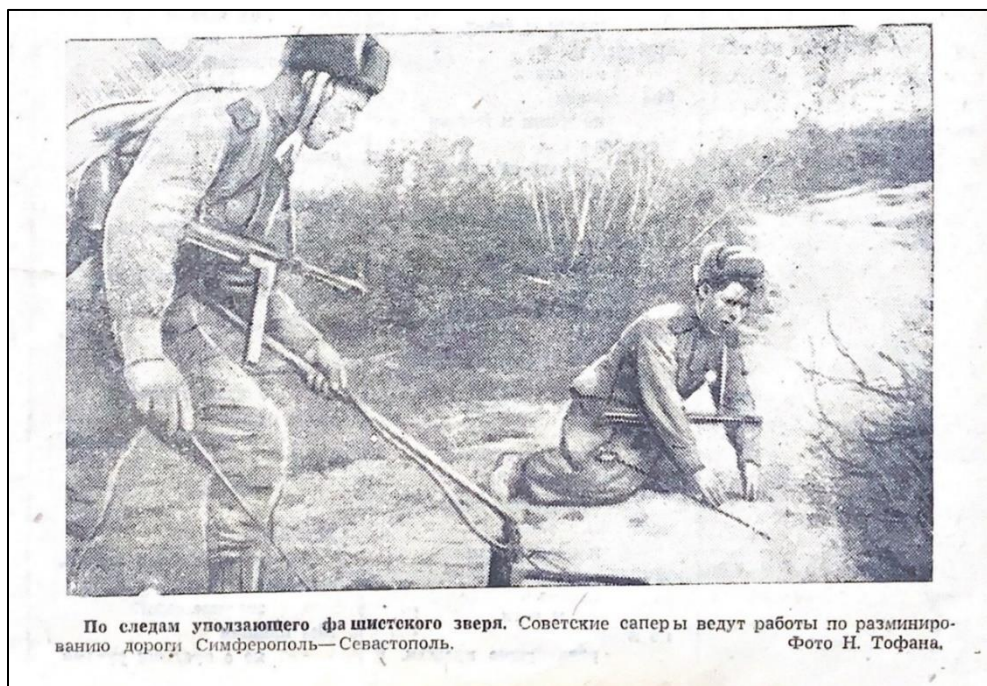
Рис. 6. По следам уползающего фашистского зверя. Советские саперы ведут работы по разминированию дороги Симферополь-Севастополь

Важнейшую роль в газете в военное время играла фронтовая фотография. Ее примером может стать фото Н. Тофана «По следам уползающего фашистского зверя. Советские саперы ведут работы по разминированию дороги Симферополь–Севастополь» (Красный Крым, № 93, 11 мая 1944 года, с. 3). В текстовой подписи к