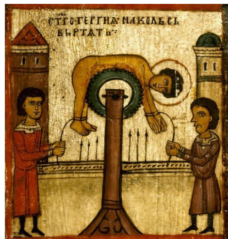
Рис. 6. Чудо св. Георгия о змие, с житием; XIV в.; Россия. Новгород. Мучение на колесе (клеймо 5)