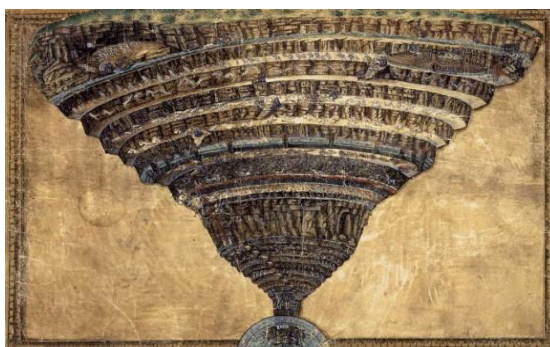
Рис. 2. Сандро Боттичелли. Круги Ада. 1480-е гг.