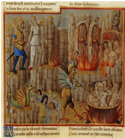
Рис. 5. Это Эней увидел в Тартаре. Потом автор «Энеиды» станет гидом Данте по аду. Французская миниатюра. Ок. 1500