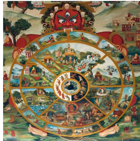
Рис. 4. Колесо Сансары