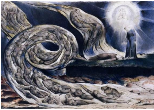
Рис. 3. Уильям Блейк. Вихрь любовников. Иллюстрация к Данте. 1827