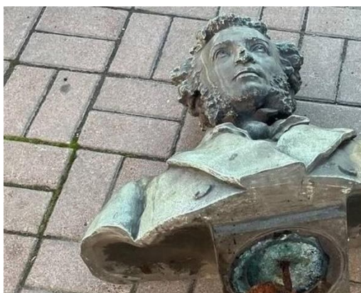
Фото 6–7. Этого памятника Пушкину, установленного в 1899 г. в Киеве, уже не существует

Памятники Пушкину снесены также в Запорожье, Жмеринке, Конотопе, Николаеве, Николаеве, Николаеве, Полтаве, Тульчине, Ужгороде, Тернополе, Харькове, Черновцах.