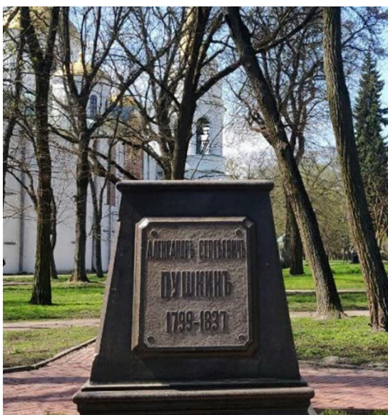
Фото 2. Чернигов. Постамент снесенного памятника Пушкину

В 1900 году, на деньги, собранные жителями, в память о пребывании гения русской поэзии в Чернигове на высоком гранитном постаменте был установлен бронзовый бюст Пушкина. Этот памятник пережил революцию 1917 г., гражданскую войну и войну Отечественную, но зимой 2007 г. он был обезглавлен. Тогда власти Украины объявили, что это дело рук неизвестных вандалов. В 2009 г. под давлением общественности памятник восстановили. Однако 30 апреля 2022 г. этот бюст был полностью снесен силами 119-й бригады территориальной обороны. И уже никто на Украине не скрывал, что памятник поэту снесли с ведома властей.