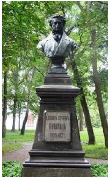
Фото 1. Бюст Пушкина в Чернигове до сноса

Как известно, А. С. Пушкин в период с 1820-го по 1824 год довольно много ездил по тогдашней российской провинции – Украине [6, 7]. 14 мая 1820 г. молодой дипкурьер Министерства иностранных дел Александр Пушкин проездом впервые посетил город Чернигов. 4 августа 1824 г., уже став знаменитым поэтом, после долгого пребывания в Одессе [11] А. С. Пушкин по дороге с юга России в Михайловское снова побывал в Чернигове.