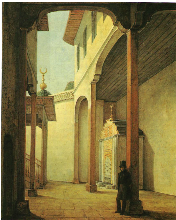
Рис. 1. Г. Г. и Н. Г. Чернецовы. Пушкин в Бахчисарайском дворце. 1837 г.