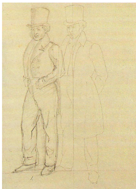
Рис. 4. Г. Г. Чернецов. А. С. Пушкин и В. А. Жуковский. 1832 г.